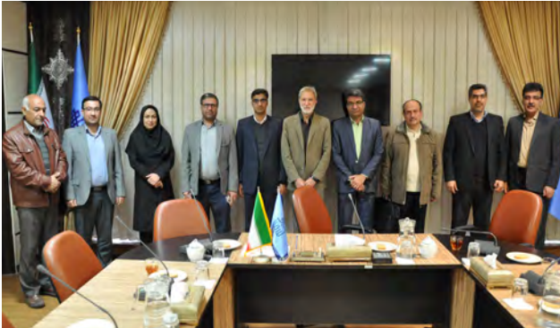
کشور استرالیا می باشد.

ایشان دارای بیش از ۵۰ عنوان مقاله علمی و پژوهشی، کسب عنوان پژوهشگر برتر استان و دانشگاه بیرجند در سال ۱۳۹۰ و سابقه ۷ سال خدمت در سمت معاونت اداری و مالی دانشکده کشاورزی است.