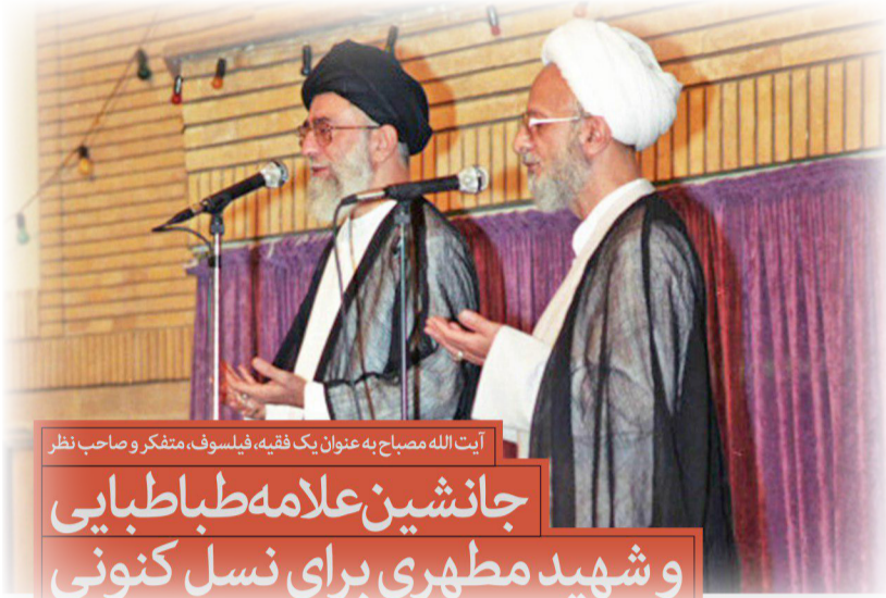
آیت‌الله مصباح به عنوان یک فقیه، فیلسوف، متفکر و صاحب نظر

ایشان پیش از انقلاب اسلامی، خطر نفوذ مارکسیسم را گوشزد کرده، خود با تدوین کتاب‌ها و جزوات و تشکیل کلاس‌های نقد مبانی مارکسیسم، به گفتار خود جامه عمل می‌پوشاندند. همچنین با پرده‌برداری از سخنان برخی روشنفکران، و نیز نقد تز «اسلام منهای روحانیت» پرده از افکار شوم دشمنان اسلام و انقلاب